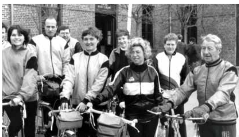
LE CLUB CYCLO