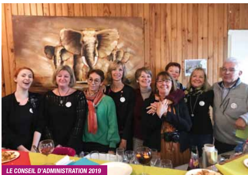
LE CONSEIL D'ADMINISTRATION 2019

Ces 50 années ont vu défiler plusieurs générations dont les intérêts pour les loisirs ont muté. L'activité la plus significative concerne le club jeune, qui lors de sa création fonctionnait simplement avec un baby-foot, un billard, voire des jeux de sociétés. Le rassemblement de nos jeunes était visible à travers le nombre de mobylettes qui stationnaient devant le chalet ; où sont-elles maintenant ? Le local permettait de se rencontrer et de communiquer. Aujourd'hui, ce n'est plus d'actualité ! La communication s'établit via les smartphones et les écrans d'ordinateurs... Force est de constater que les attentes des jeunes