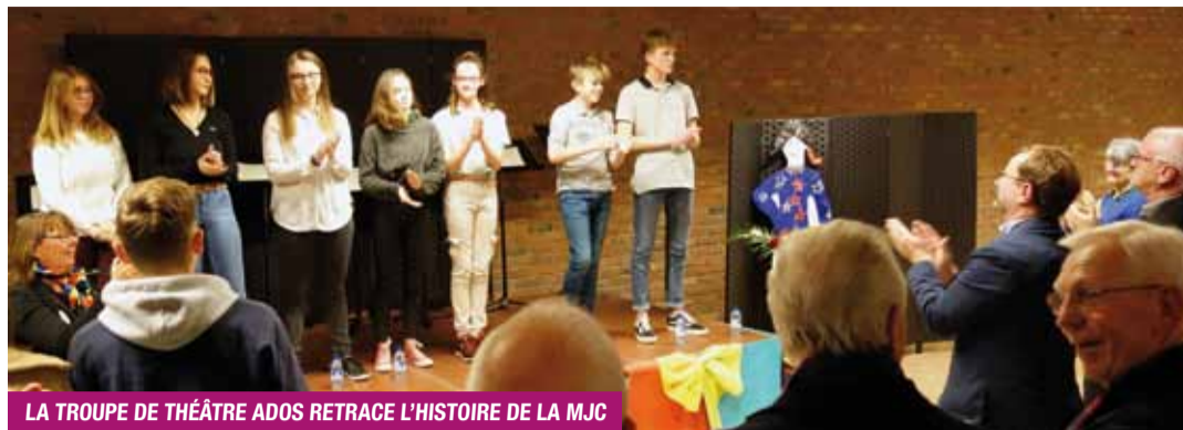
LA TROUPE DE THÉÂTRE ADOS RETRACE L'HISTOIRE DE LA MJC