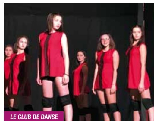
LE CLUB DE DANSE