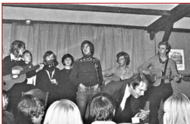
Les 50 ans de la MJC