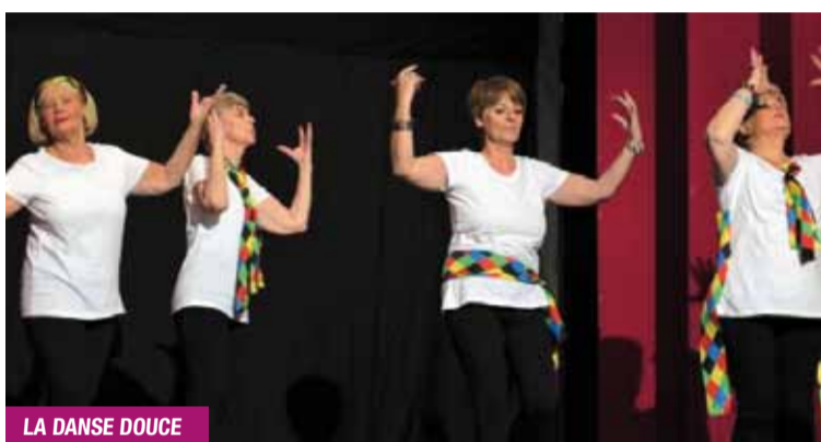
LA DANSE DOUCE