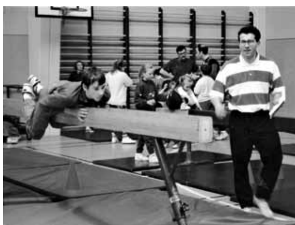
LE COURS DE GYM