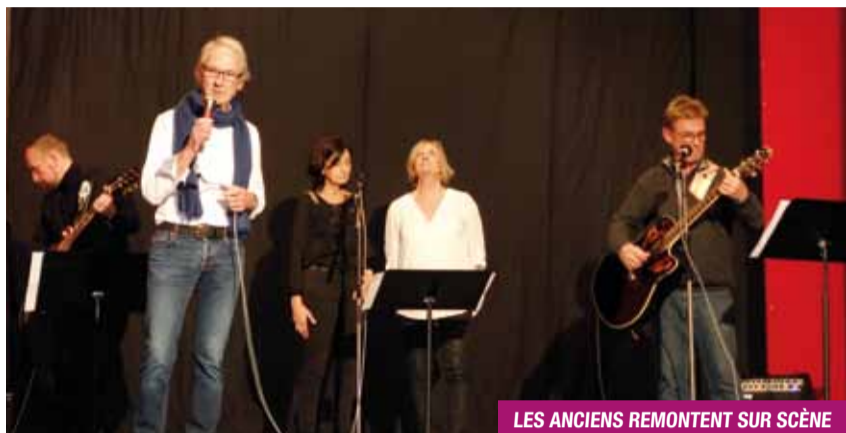
LES ANCIENS REMONTENT SUR SCÈNE