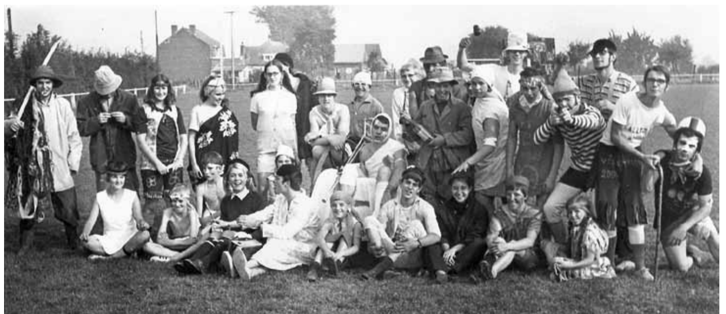
LA DUCASSE LE 07-09-1969