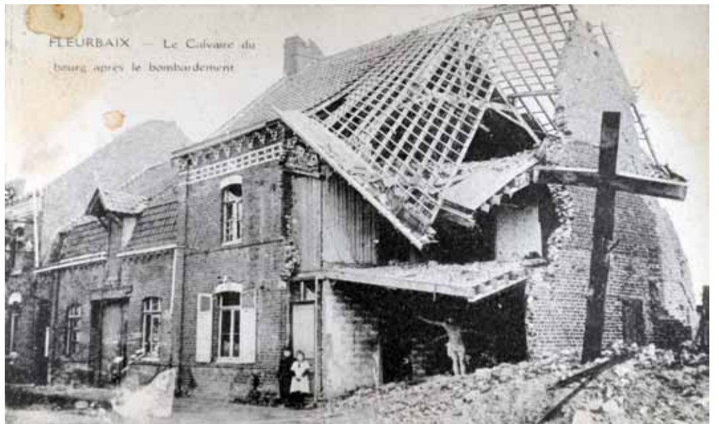
LES FAMILLES RENTRÉES AU COURS DE L'ANNÉE 1919 SONT CONFRONTÉS À LA DÉVASTATION DU VILLAGE, NOTAMMENT AUTOUR DU CALVAIRE DE LA BELLE VUE

la commune jusqu'en septembre. Un siècle plus tard, plusieurs sites répartis sur le territoire communal témoignent de cette histoire.