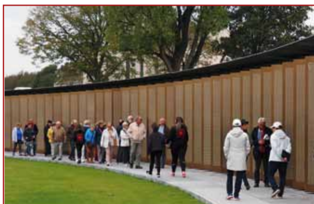
L'anneau de la mémoire