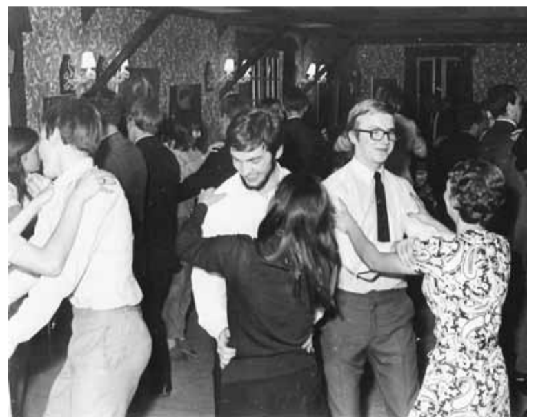
SOIRÉE FOLKLORE FESTIVAL LE 19-07-1970