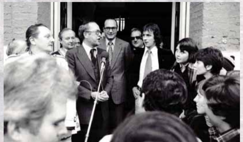
Jacques Chirac est venu à Fleurbaix en 1978.