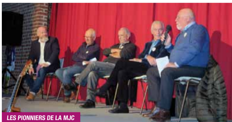
LES PIONNIERS DE LA MJC