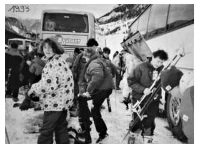
SÉJOUR AU SKI