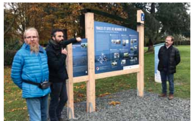
Sur les traces de notre Histoire