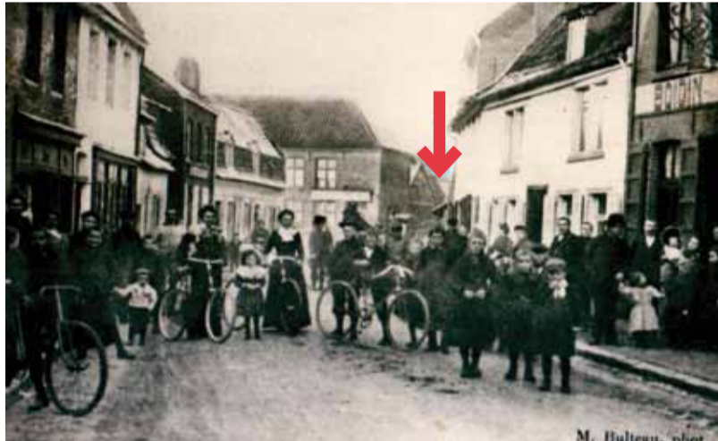
AU BOUT DE LA RUE ROYALE, LA RUE DES ARMÉES

Après la guerre, la municipalité décida de maintenir cette